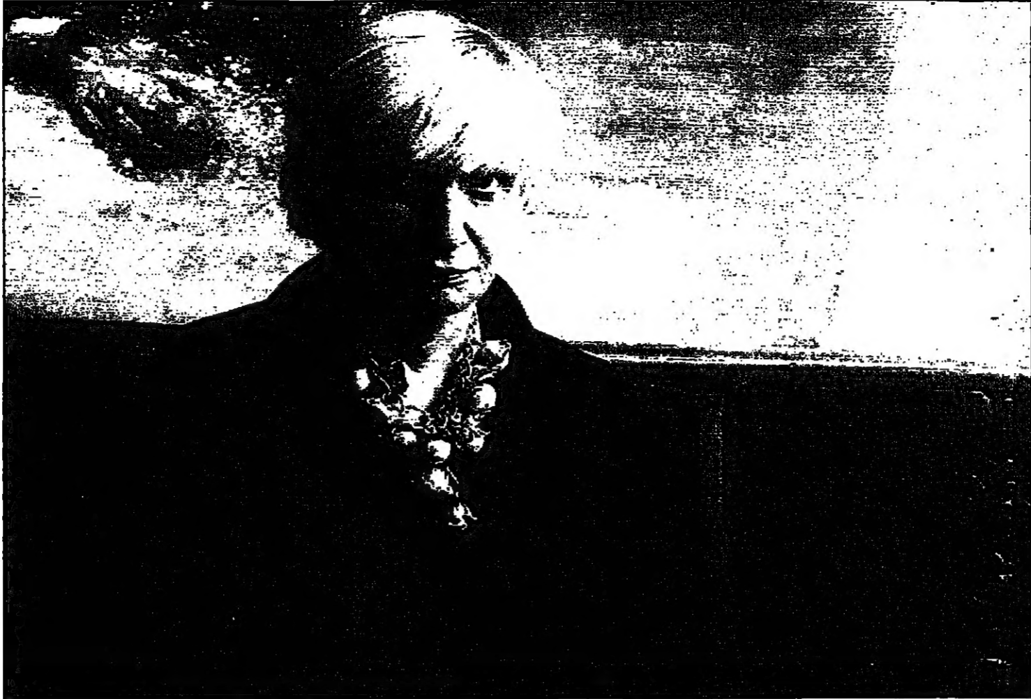
باريس - القدس العربي